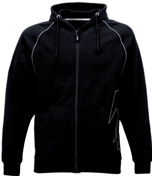
5898 Hoodie-Sweatjacke OSLO