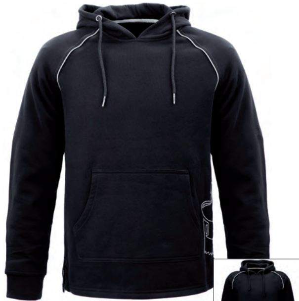
5795 AMRUM Zimmerer