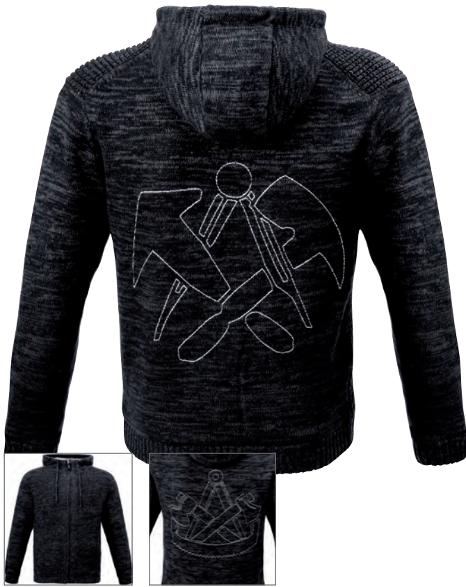
57092 Dachdecker-Strickjacke JENA