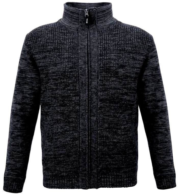
57095 Strickjacke GERA