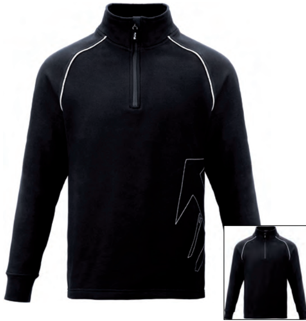
5797 BAKUM DACHDECKER