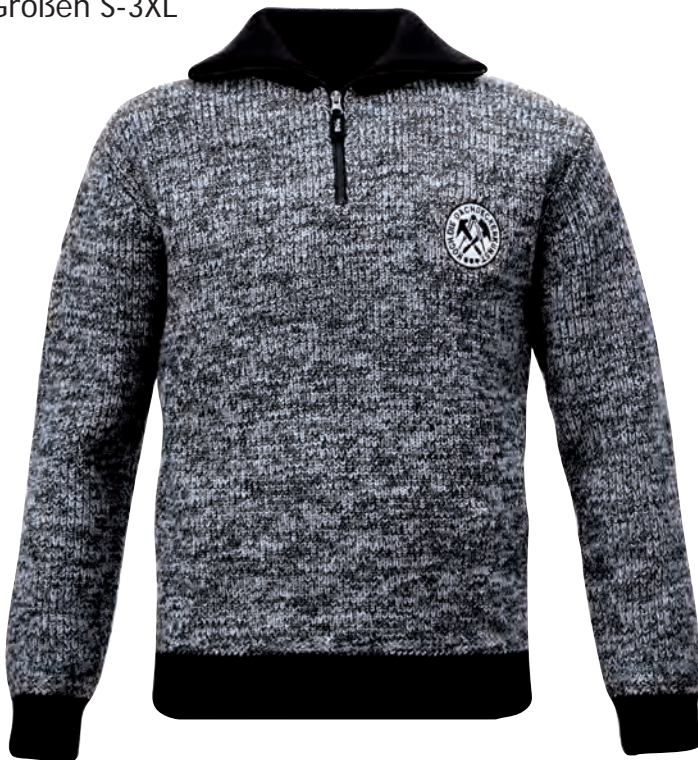
5703 Dachdecker-Troyer STUTTGART