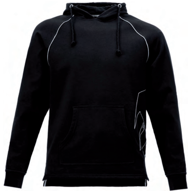
5798 STOCKHOLM DACHDECKER