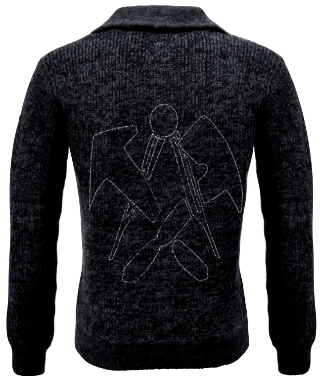
57031 Dachdecker-Troyer ROOFER